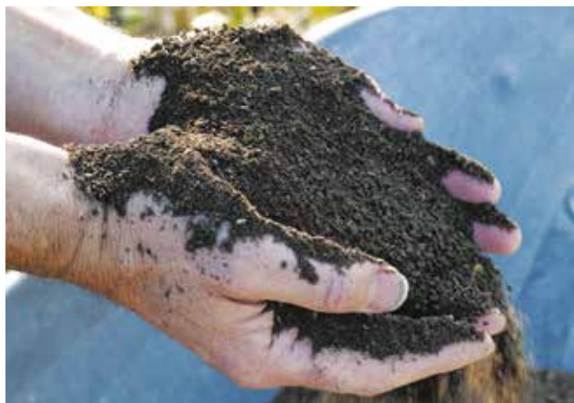
Le compost mûr se caractérise par sa couleur foncée et sa structure grumeleuse.

Il favorise la croissance des plantes et leur développement racinaire.